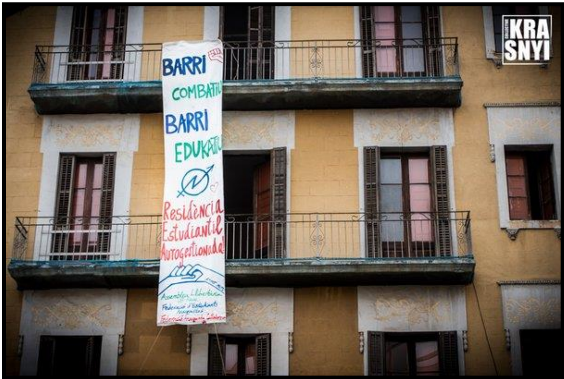
(“Barri combatiu, barri educatiu. Residència Estudiantil Autogestionada” de Krasnyi-BCN)

Per altra banda el projecte neix com a idea a l'Assemblea Llibertària de la UB-Raval, i gent que actualment el forma són militants de la Federació d'Estudiants Anarquistes i de la Federació Anarquista de Catalunya, aquesta última encabint-ho dins de la campanya: 'No és una campanya, és una forma de viure, d'actuar', on varis col·lectius de la Federació presentaran projectes sota el paraigües de Simulacres de Democràcia Directa (SDD). Així es vol donar un espai a les organitzacions comentades a l'edifici.