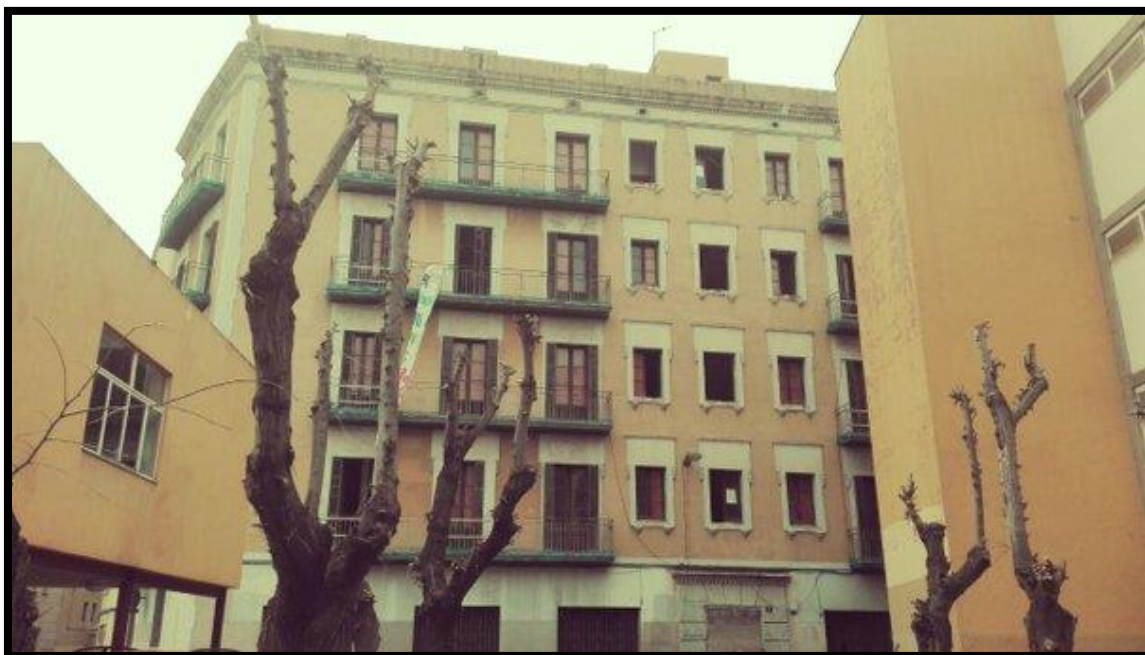
(L'edifici, la REA, que es perllonga per les dues cantonades)

Tal i com al cartell es relata, després hi havia dinar, acompanyat de música. Cous-cous amb verdures. En aquell moment va aparèixer la policia amb uniforme i ens va comunicar que la seva assistència era deguda a una trucada pel soroll que estàvem fent i no pas per l'apertura en si, i que també estàvem obstruint la via pública i era delictu. Van començar a venir uns quants cotxes de la guàrdia urbana, pel tema del soroll -deien. A causa de la presència policial els concerts no es van realitzar, ja que la tensió mútua ens advertia que calia estar alerta.